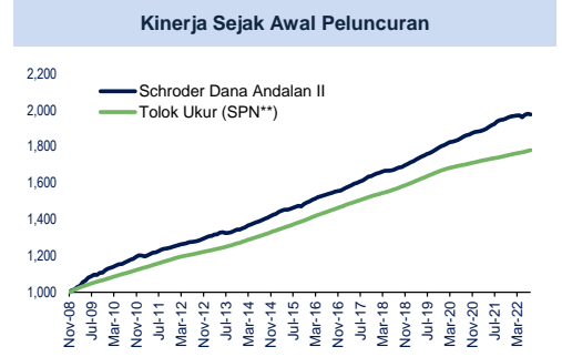
Grafik kinerja dihitung dengan mengikutsertakan dividen yang direinvestasikan.

INFORMASI LEBIH LENGKAP DAPAT DILIHAT DI PROSPEKTUS YANG DAPAT DI AKSES DI WWW.SCHRODERS.CO.ID